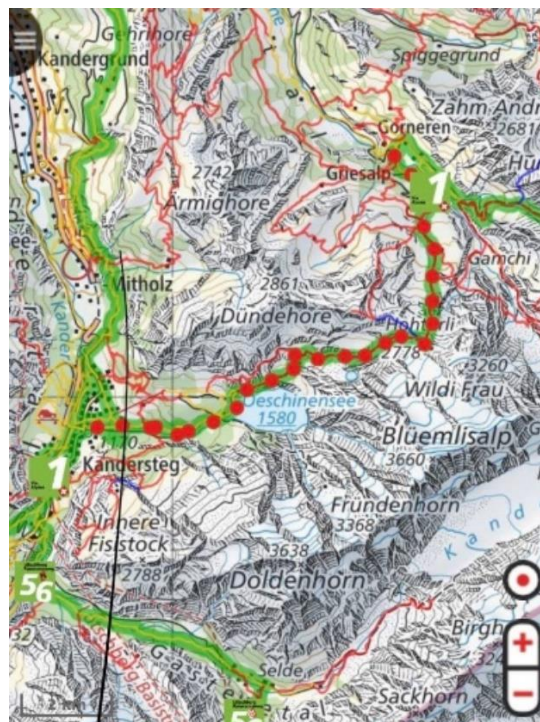
Karta över vandringsled Griesalp-Kandersteg