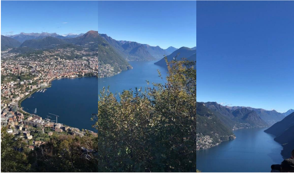
Monte San Salvatore i Lugano