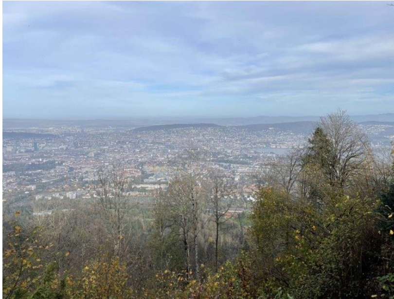
Uetliberg i Zürich

Det var mycket fokus på choklad och ost, där ostfondue och Lindt tog stor plats. Bland annat rekommenderas ett besök på Lindt-museet i staden. Det finns även flera andra museer att besöka, till exempel Fifa-museet, och andra fina byggnader att spana in.