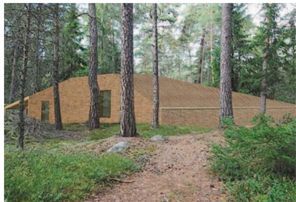
Fig 2 & 3: Det nya krematoriet En sten i skogen . Illustration: Johan Celsings Arkitektkontor.