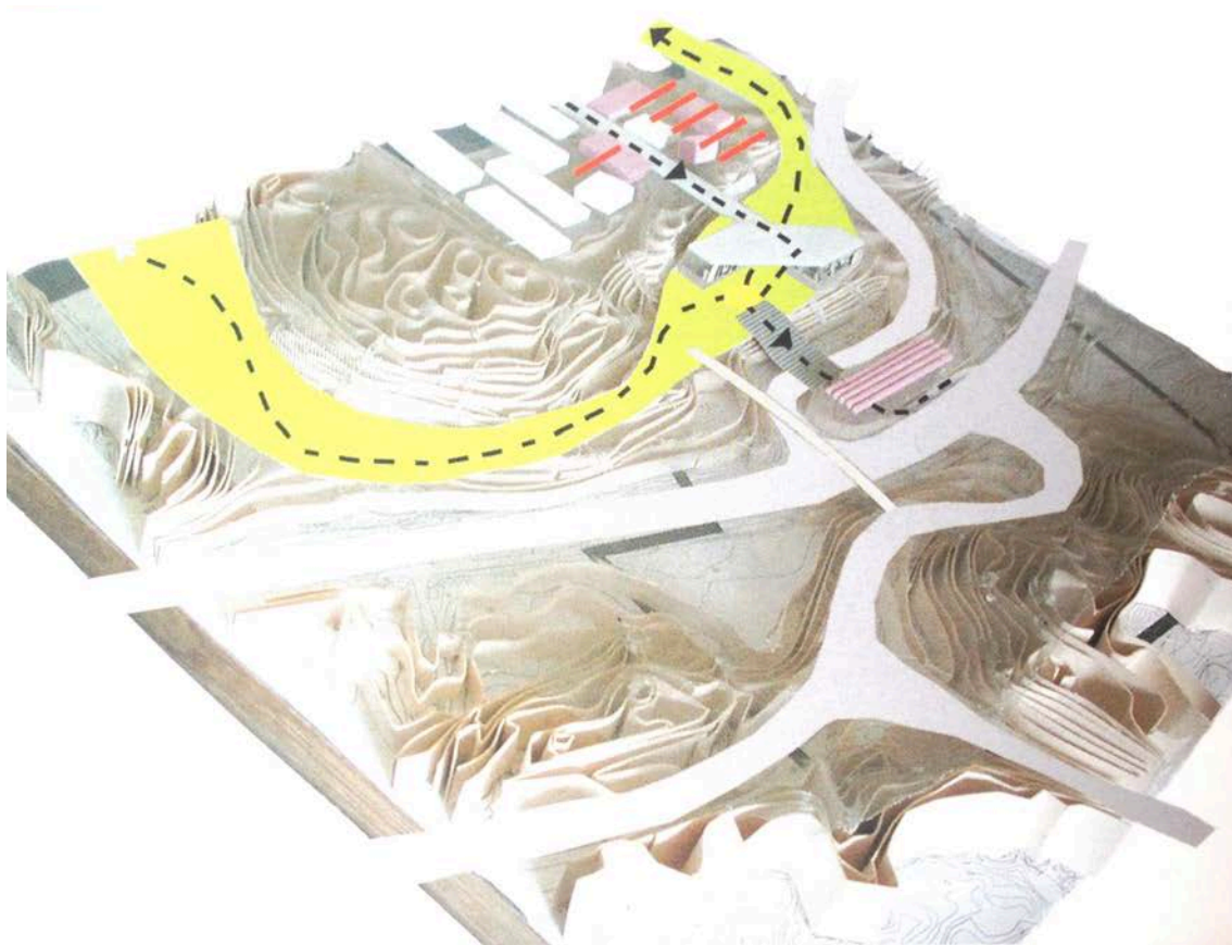
Figur 1: Europan 7 – Det vinnande förslaget i Göteborg, Gårdsten