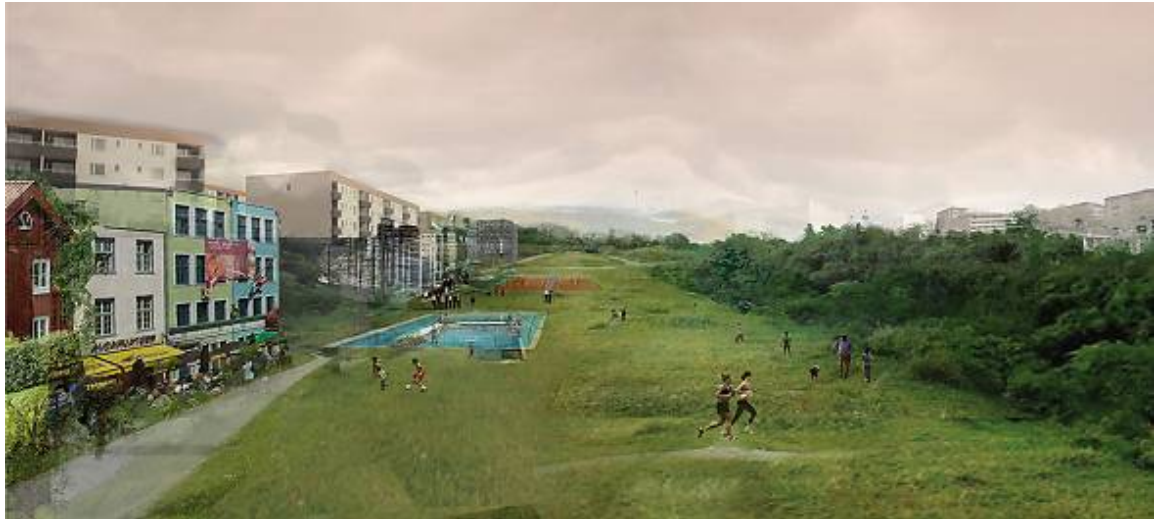
Figur 4: European 11 – Det vinnande förslaget i Norrköping