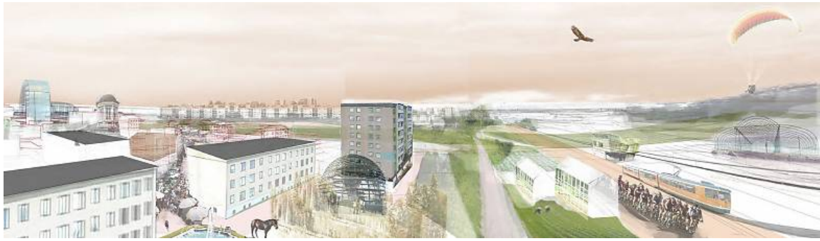
Figur 3: European 11 – Det vinnande förslaget i Norrköping