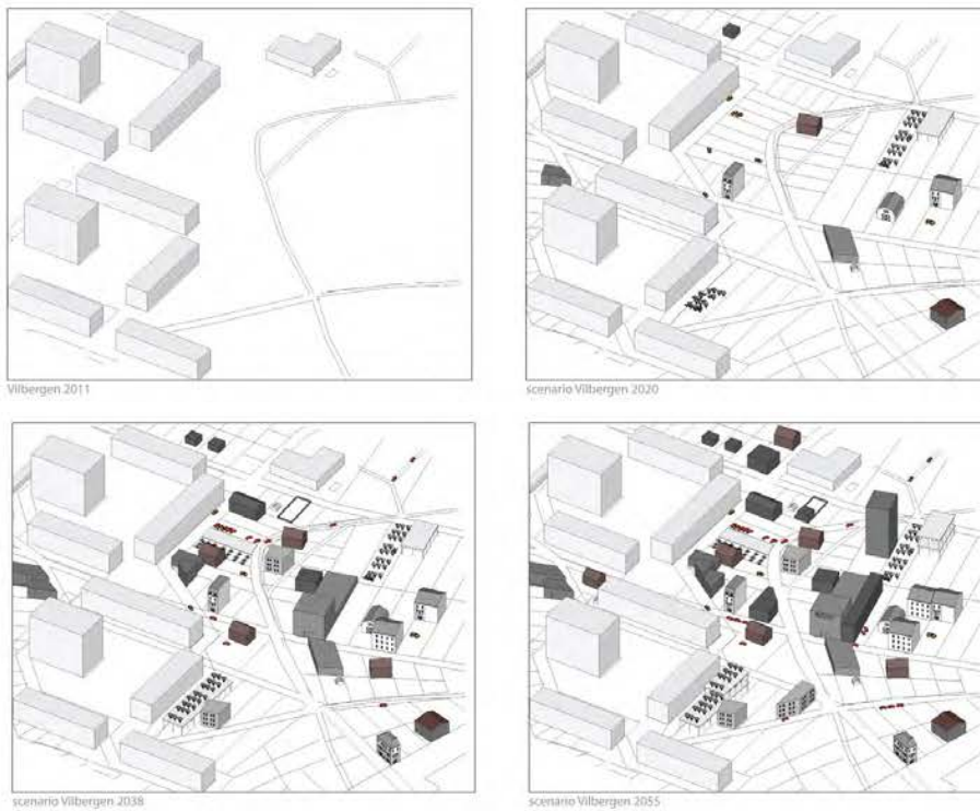
Figur 5: European 11 – Det vinnande förslaget i Norrköping