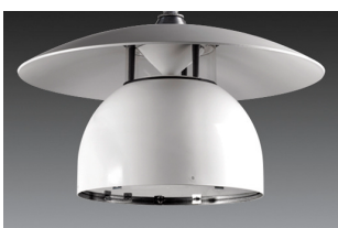
Exempel på produktfoto från Huddinges GP.