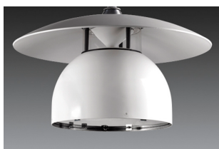
Exempel på produktfoto från Täbys GP.

Programmen har illustrationer bestående av foton, kartor och teckningar. Nedan följer en kvantitativ bedömning av fördelningen. En illustration kan naturligtvis innehålla flera motiv samtidigt, såsom t ex en människa som tittar på ett konstverk i en teknisk lösning, den har då klassificerats i alla relevanta grupper.