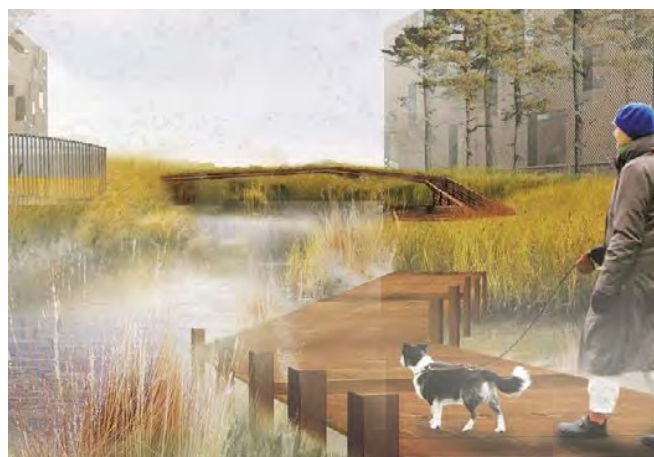
Bild 3, Bild perspektiv från plan som föreställer oftast