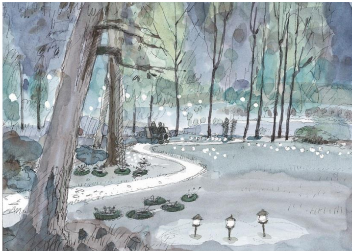
MINNESLUND MED MINNESPLATS

Lätt ljus men skapar en känsla av minneslund. Längs en slingrande smal väg finns spridda ljuslappar. Här kan man hitta sin favoritsittplats och placera blommar och lysa efter eget tycke. Småskalig belysning gör ett svagt skimmer i trädkronorna.