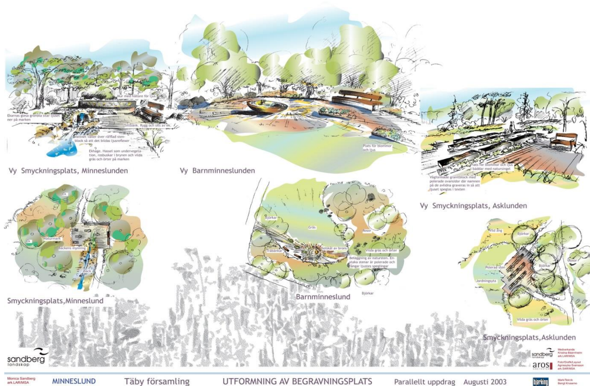
Fig 2: Plansch nummer 6 i Sandberg landskaps tävlingsförslag. Planschen illustrerar hur de tänker sig gestaltningen av minneslund, barnminneslund och asklund.

Ekonomi: Ekonomiska aspekter berörs endast då det gäller nedgrävning av den luftburna kraftledningen. Sandbergs ser helst att ledningen grävs ner helt utanför begravningsplatsen men utifrån ekonomiska argument anser de inte detta vara realistiskt.