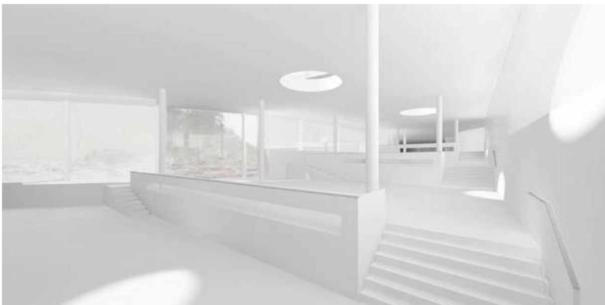
Bild från den inre miljön till det vinnande förslaget.