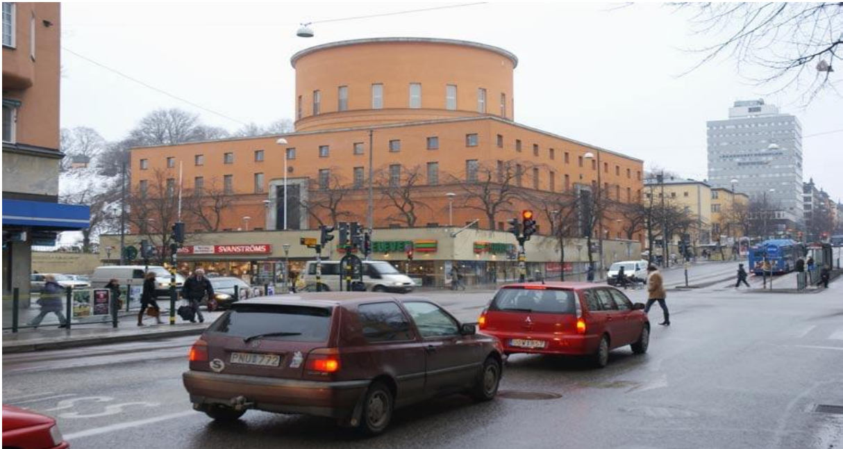
Asplunds bibliotek.