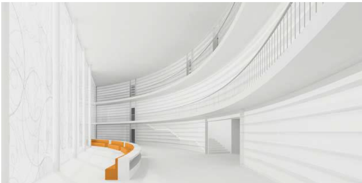
Bild från den inre miljön till det vinnande förslaget.