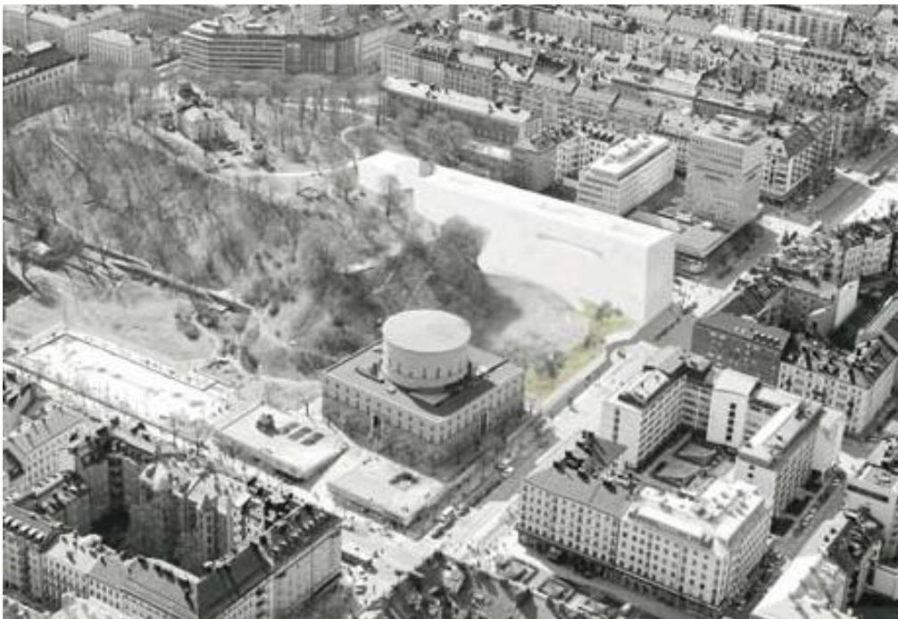
Bilden visar det vinnande förslaget i ett översiktsperspektiv.