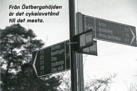
Från Östbergahöjden är det cykelavstånd till det mesta.