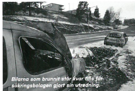
Bilarna som brunnit står kvar tills försäkringsbolagen gjort sin utredning.