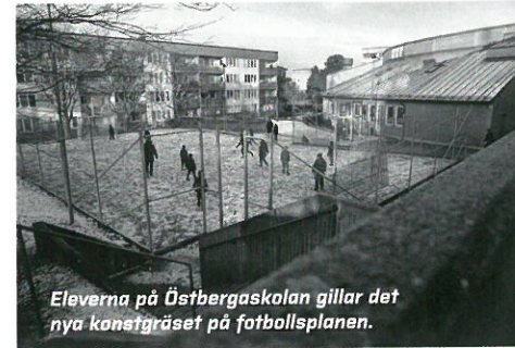
Eleverna på Östbergaskolan gillar det nya konstgräset på fotbollsplanen.