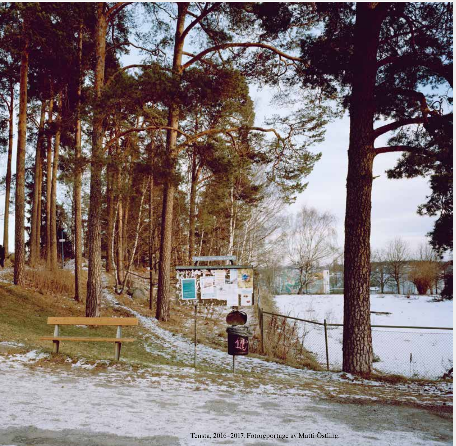
Tensta, 2016–2017.

”stadsplanekvaliteter, som sällan kan mätas eller värderas i kronor” i denna utveckling. Det uppmanades även att ”exploateringen avpassas så att reservområden och ’andrum’ finns för ännu okända behov” i framtiden och påmindes om ”att de bostäder, som vi bygger i dag, kommer att bestå i flera generationer”.