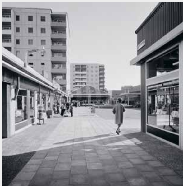
Sid 180: Dags för ett nytt miljonprogram?