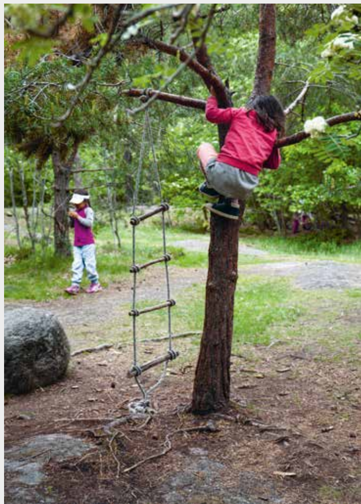
Sid 79, Varför ska barn vara på taket?