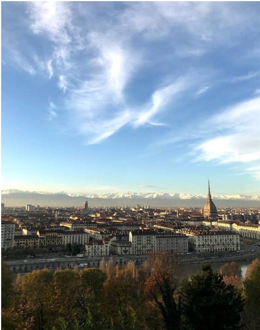
Utsikt från Monte dei Cappuccini.

Utbyte i Turin som blev för hastigt avslutat.