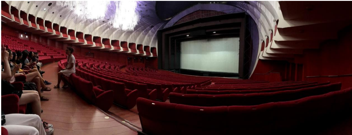
Figur 1. Bild från rundvandring inne på teater Regio

Det finns mycket kultur i staden och många museer och andra landmärken att besöka. Tips är att gå en gratis guidad tur.