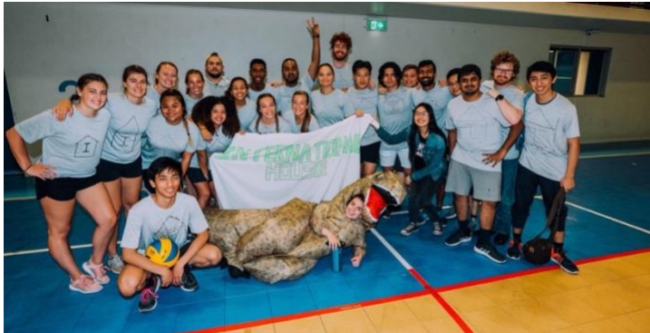
Några i mitt boende under en sportturnering via universitetet

rollspel, debattkväll, spelkväll eller andra tävlingar, vilket alltid var kul att vara med på. Varje korridor hade en Student Leader, SL, som är mer ansvarig och det gick alltid att vända sig till någon av dem om det skulle vara något. Boendet låg ca 20 minuter gång från stranden, 20 min gång från Wollongong centrum och 5 minuter med buss från universitetet, som var gratis för alla studenter. Alla måltider ingick och serverades i en "skolmatsal" där vi alla åt tillsammans. Frukosten och middagen var väldigt bra, men lunchen var dock sådär då det bara var lite plocksallad och mackor. Har aldrig varit så trött på mackor som efter detta utbyte.