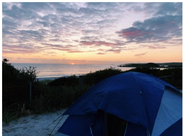
12 apostlarna längst great ocean road och soluppgång i Bay of Fires, Tasmanien