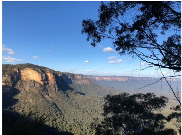
Royal national park och Blue Mountains

Det finns också hur mycket som helst att se i andra delar av Australien, men det är samtidigt lätt att glömma bort hur enormt stort landet är. Se därför till att ge dig själv mycket tid när du reser längre sträckor så du hinner se allt på vägen, ibland kunde det bli lite väl korta stopp eller en halvdag i bilen för att kunna hålla tidsschemat. Under spring break bilade jag och två kompisar ner till Melbourne med flera stopp på vägen, och därifrån vidare ner till Tasmanien. I tentaperioden åkte jag till Uluru och Alice Springs i the Outback med 4 andra kompisar och efter terminen reste jag längst östkusten en månad och åkte till Nya Zeeland 2,5 vecka.