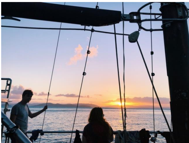
Övernattning på en båt i Whitsundays

Och sist men inte minst – våga åka! KTH kan ofta avråda från att åka på utbyte vissa terminer, men om det inte bara är väldigt specifika, obligatoriska kurser under den terminen så går det ofta att hitta motsvarande kurser på andra universitet om du bara söker runt ordentligt och kanske frågar äldre elever. Att åka på utbyte kräver ofta mycket efterforskning, men det är det verkligen värt. Ens utbyte är helt enkelt en fantastisk upplevelse som du inte vill gå miste om, där en får både minnen och vänner för livet!