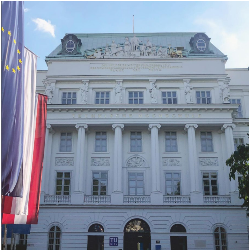
TU Wien's huvudbyggnad.