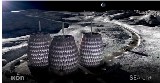
Bilder från ICON's projekt Lunar Lantern. ICON hade en gästföreläsning i Extreme Architecture.