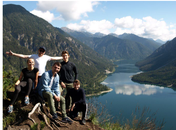
Bilder från delar av utsikten i Am Plansee.