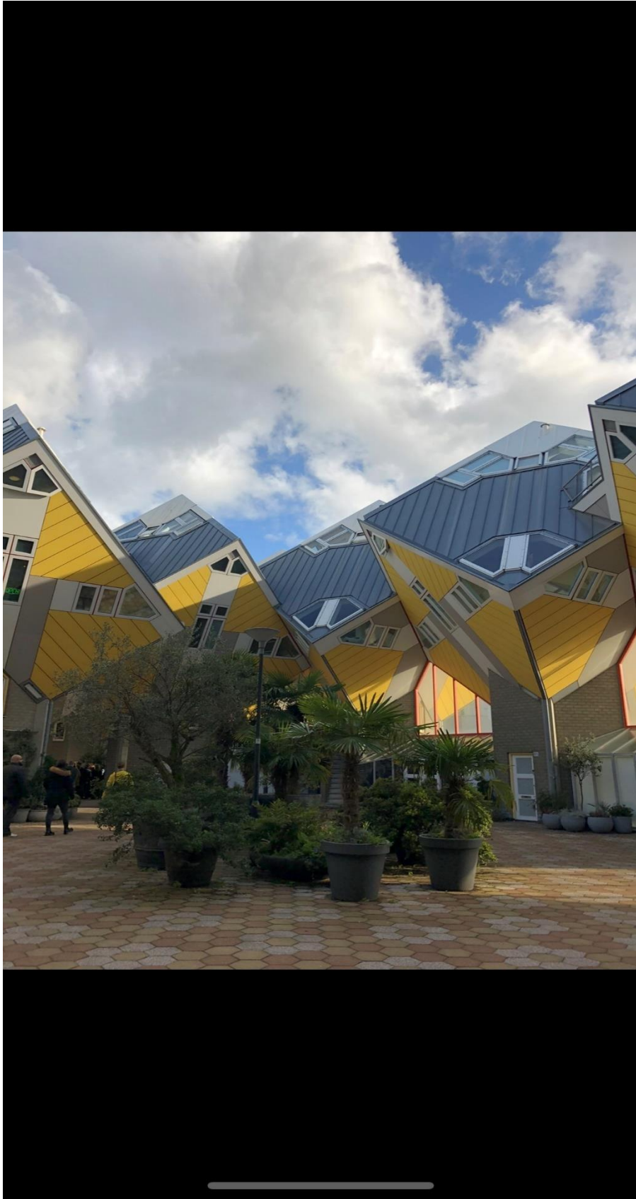
Rotterdams fina arkitektur