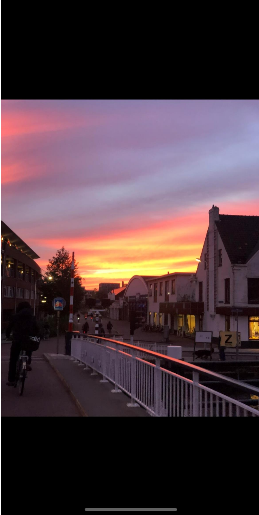
Många solnedgångar som man fick se påväg hem från skolan