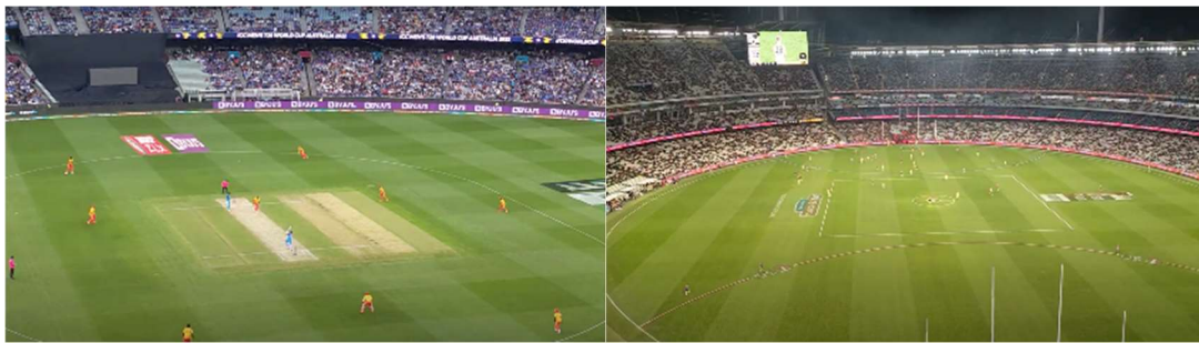
Cricket och AFL på MCG

Förutom detta så är Melbourne känt som "Australia's sporting capital". På vintern finns det australiensisk fotboll – AFL, som är den största sporten i Victoria. Utbytesstudentföreningen MUSEX arrangerade biljetter till en av matcherna. Senare in mot sommaren hölls T20 VM i cricket, Big Bash League och Boxing Day Test, vilket är ett av de största evenemang i Australiens cricketkalender. Det bästa med sportevenemangen i Melbourne är att biljetterna är oftast väldigt billiga och börjar under A$20.