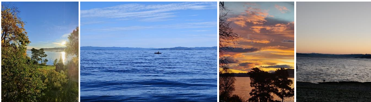
Figur 2. Min havsutsikt på Lade.

Bostadspriserna i Trondheim tyckte jag var relativt höga men jag upptäckte snabbt att många löser det genom att bo i kollektiv som du hittar över hela staden. Jag hittade boenden via organiserade sidor som finn.no, hybel.no etcetera. Via hybel skapade jag en profil och skrev till många där och även på vissa FB-sidor. Tyvärr är många inte så värst intresserad av att hyra ut sina rum för endast en termin och därför kan du behöva kämpa lite för att hitta ett bra boende. Men, du kommer att hitta något! Många studenter väljer att bo på Tyholt eller Moholt men jag hittade ett boende på Lade, ca 5-6km från campus Gløshaugen. Jag trivdes väldigt bra på Lade, ett lugnt område precis vid Ladestien dit många familjer åker till på söndagarna för en liten tur. Jag hade havsutsikt från mitt fönster och bara 200 meter till närmsta badplats.