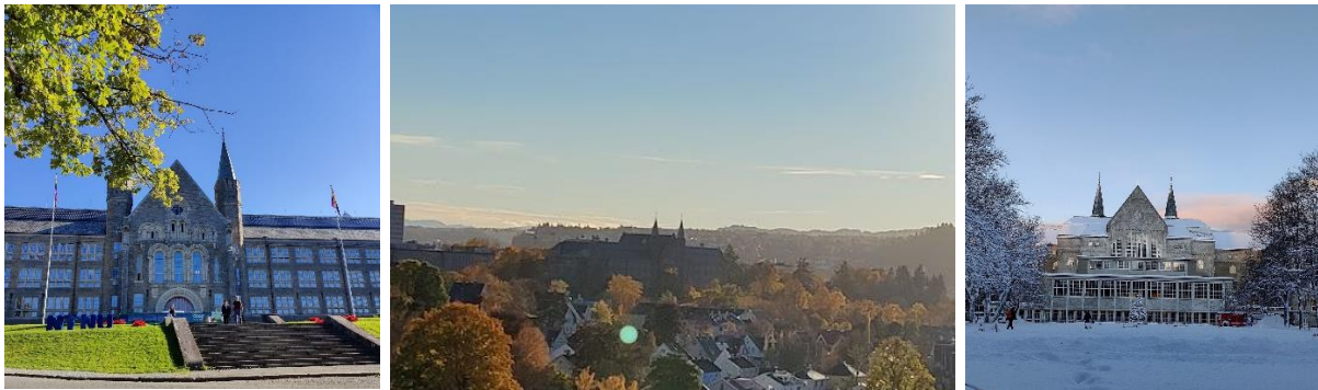
Figur 3. Campus Gløshaugen.

NTNUs motsvarighet till "Civilingenjör inom Samhällsbyggnad" heter "Bygg och Miljöteknik" som bygger på att erbjuda samma bredd i branschen som utbildningen på KTH. En kurs jag läste undervisas på norska, vilket till en början var en utmaning men som blev lättare med tiden allt eftersom jag exponerades av det norska språket. Tack och lov fick jag tillåtelse att skriva en essä och tentamen på engelska i denna kurs. De resterande 3 kurserna hölls på engelska. I alla kurser finns dock ett minimumkrav på din kursaktivitet för att ens få skriva den slutliga tentamen. I beräkningskurser kan det betyda att du måste lämna in x antal lösningar på uppgifter under kursens gång och fått dessa godkända dagen innan du ska skriva tentamen. Tentamen skrivs i slutet av terminen och en tentaperiod kan pågå från slutet av november till bara någon dag före jul. Tentadatum släpps tidigt så du kan planera denna tid innan du påbörjar kurserna.