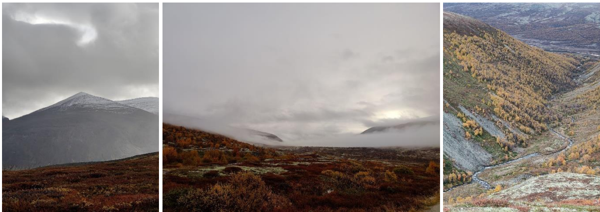
Figur 5. Vandring i Dovre med NTNUI Ski og Fjällsport.

Ett annat sätt att utöva träning på är via SIT som har tränings-och hälsocenter på flera ställen i Trondheim. Ett sådant träningscenter finner du ca 5 min gång från campus Gløshaugen som har gym och erbjuder olika gruppträningar. Trondheim har även ett stort utbud för dig som gillar att klättra och du hittar bouldring-och sportklättringshallar utspridda runt hela stan.