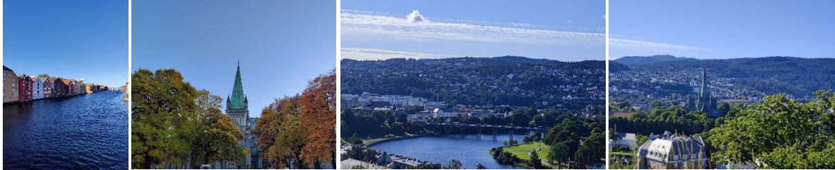
Figur 4. Min första vecka i Trondheim bjöd på fint väder. Lyckligtvis höll detta i sig terminen ut!

Trondheim är en väldigt fin och trevlig stad med Nidarosdomen som landmärke. Många som bor här delar intresset för sport och träning. Studentsamfundet hittar du i centrum och dit går studenter för att festa eller lyssna på panelsamtal.