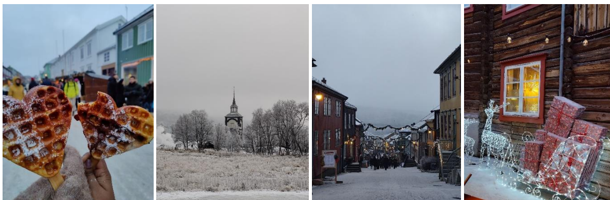
Figur 7. Julmarknad i Røros.

Trots att många i Trondheim väljer att cykla valde jag att köpa busskort för ett halvår, något jag är väldigt nöjd med. Kollektivtrafiken fungerar väldigt bra, bussarna går ofta och förbi många ställen runt om i staden. Som tidigare nämnt säljs utgående artiklar till lägre pris på många affärer och staden är väldigt duktig på att lyfta upp sina lokala producenter. Ett hett tips för dig som besöker Trondheim under hösten är att gå på julmarknaden i Røros. Här kan du provsmaka och köpa närproducerad mat och samtidigt få en go julstämning.