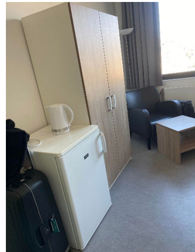
Bilder på mitt rum vid ankomst.

I bottenvåningen av vår byggnad fanns det som sagt ett stort gemensamhetsrum som man kan hänga i eller boka och ha tex fester i. I den andra delen av byggnaden så är det också en jättetrevlig bar/restaurang med bla bouleanor. Så finns det kvar i Professor S skulle jag absolut rekommendera detta! Går det att välja så ta ett rum i en av de högre våningarna, då får ni sol på den gemensamma balkongen nästan hela dagen samt välj ett rum som inte väter mot innergården, då slipper ni insyn från de andra korridorerna. Jag bodde på våning 5 i korridor 103, rum 3 och hade ett rum mot kanalen.