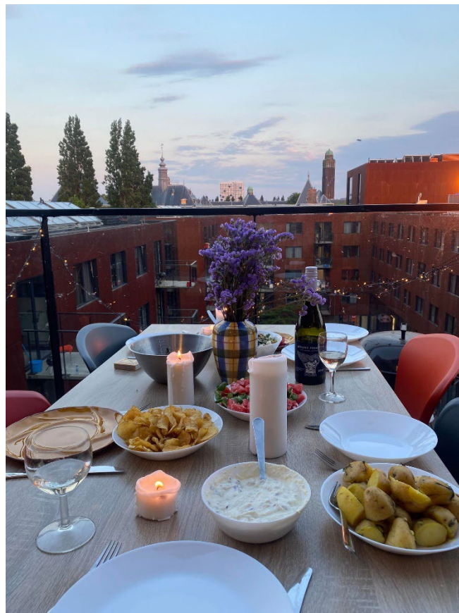
En av alla Sunday bbq som jag och mina korridorkompisar hade varje vecka i vårt kök.

Jag var väldigt snabb med min ansökan och hade hela tiden koll på min mail. Så jag hamnade i gruppen som fick välja boende först. Jag hade pratat med en tidigare klasskompis, som var på plats, om vart han tyckte jag skulle bo och även läst på lite själv. Så jag valde ett rum i korridor, med eget badrum och delat kök med 7 andra. Byggnaden heter Professor Schermerhornstraat .