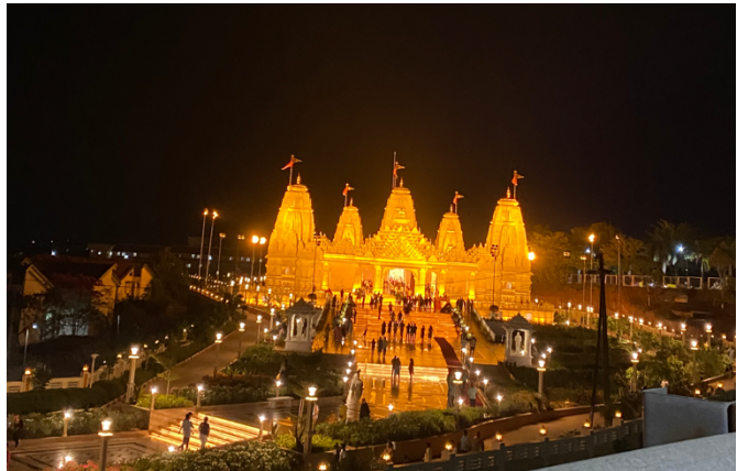
Tempel intill campus