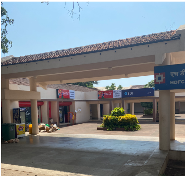
Mataffär och bank på campus

Jag gjorde inte detta, men jag skulle nog rekommendera att kolla upp möjligheterna att skaffa ett indiskt bankkonto. På många ställen tog de inte kort, utan använde i stället en Swish-liknande app. Den appen kunde man dock inte använda utan indiskt bankkonto så jag fick ofta gå och ta ut kontanter. Ibland kunde man heller inte betala med kort i matsalen. Oavsett skulle jag rekommendera att skaffa ett bankkort som är billigt att använda i utlandet.