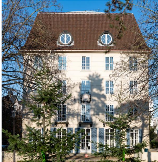
Bild av Svenska Studenhemmet