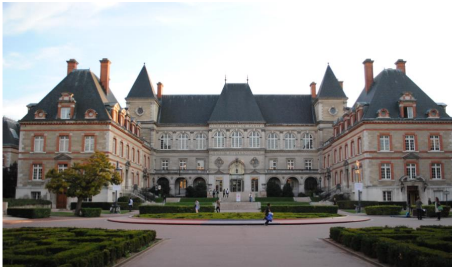
Bild: Internationella huset, där finns det restaurang, biblioteket, teater, mm.