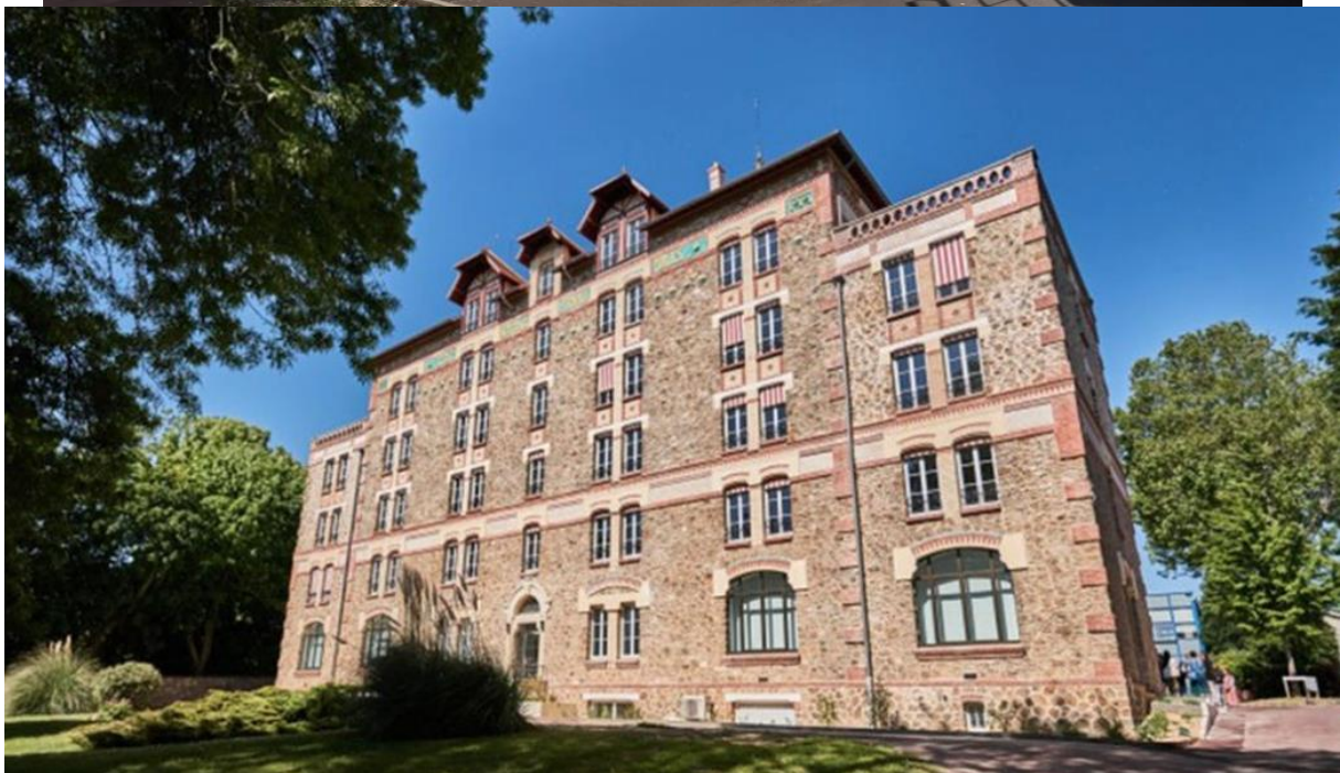
Bilder på ESTP Cachan