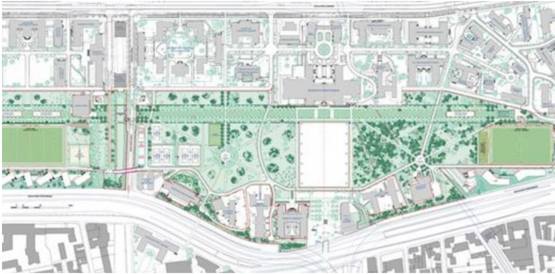
Plan på Cité universitaire