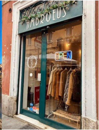
Vintage butik Ambroeus (Milano)