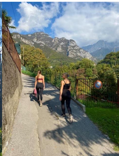
Vandring Mandello del Lario (Como)