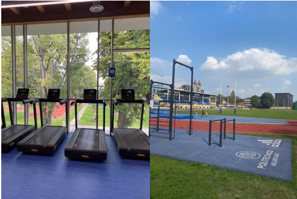
Skolans gym/träningsanläggning på Leonardo

Jag hade sparat pengar till hösten för att kunna passa på att åka på flera resor, äta ute och njuta av allt Milano har att erbjuda. Jag skulle rekommendera att spara ihop en liten buffert så man kan få ut så mycket som möjligt av sitt utbyte.