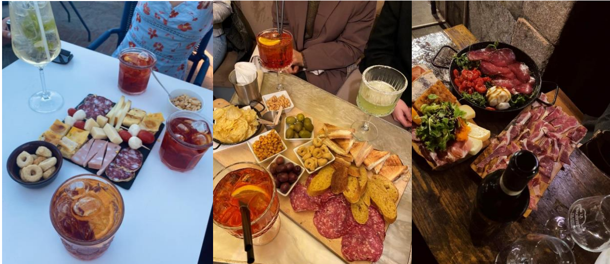
Aperitivo 's i mängder