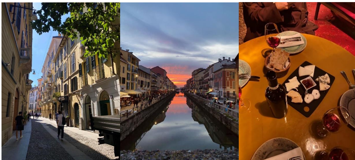
Gator i Brera

Jag saknar staden redan och är säker på att jag kommer åka tillbaka till Milano många gånger i livet.