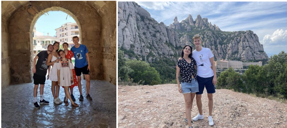
T.v. Bild från en vecka på Mallorca med Erasmus-kompisar: T.h. Det sågtandade berget Montserrat med fint sällskap

Förutom de nyss nämnda Santiago och Madrid besökte jag även Valencia (under stadsfestivalen Les Falles ), Mallorca (bild nedan), Pamplona (under San Fermín ), Vigo samt upptäckte det mesta som går i Katalonien. Värt att nämna där är sagolika berget Montserrat, Girona, Dalí-museet i Figueres, samt mängder av strandpärlor längs Costa Brava som Tossa de Mar och S'Agaro.