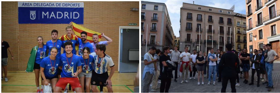
T.v. Segerbild från International Erasmus Games i fotboll: T.h. ESN-guide visar Erasmus-studenter från hela Europa Madrid.

Förutom de nyss nämnda Santiago och Madrid besökte jag även Valencia (under stadsfestivalen Les Falles ), Mallorca (bild nedan), Pamplona (under San Fermín ), Vigo samt upptäckte det mesta som går i Katalonien. Värt att nämna där är sagolika berget Montserrat, Girona, Dalí-museet i Figueres, samt mängder av strandpärlor längs Costa Brava som Tossa de Mar och S'Agaro.