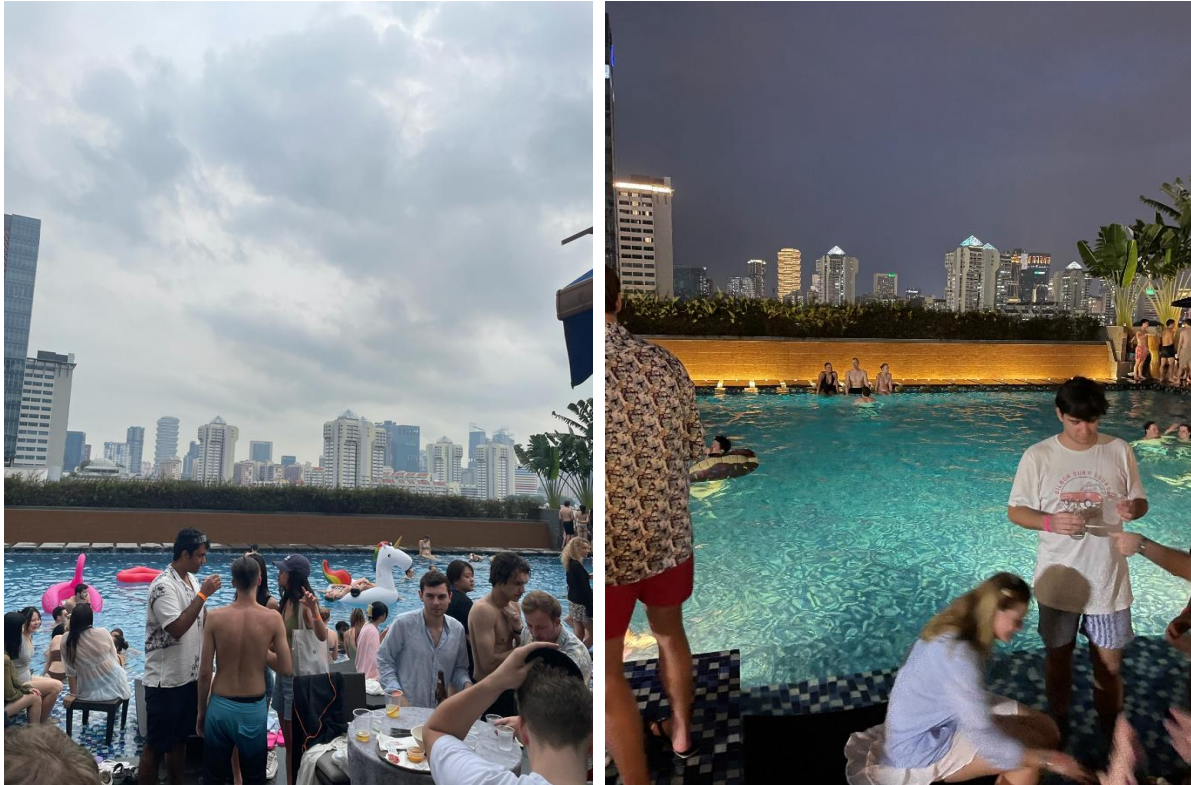
Ett av fest-eventen anordnat av "Hazel's guestlist".