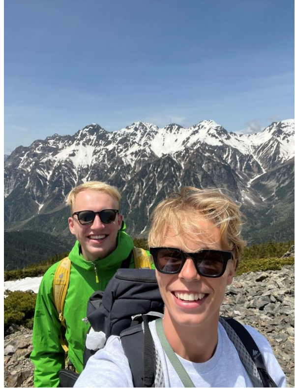
Bild på mig och två av mina närmaste vänner (från Kanada och Nederländerna).