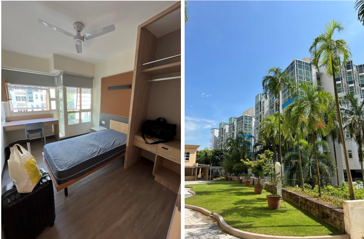
Mitt rum och PGPR Campus (förvänta dig inte det där vädret ofta).