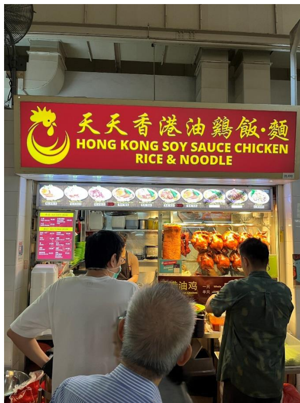
Ett av många hawker centers.