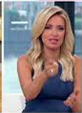
FOX NEWS CHANNEL CLIMATE ACTIVISTS THROW POTATOES AT $110M PAINTING OUTNUMBERED