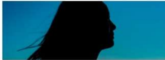
Lean Ledarskap 7,5 hp