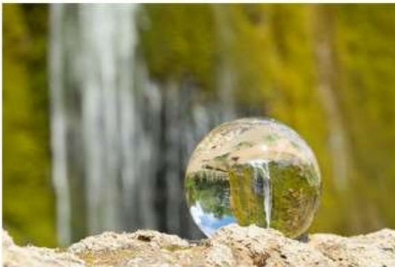
Lean & Greenkurs: 4 halvdagar