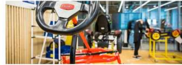
Lean Produktion 7,5 hp