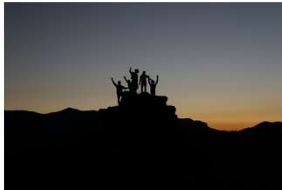
Hållbart ledarskap med lean, webbaserad