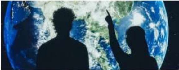
Hållbarhet i praktiken