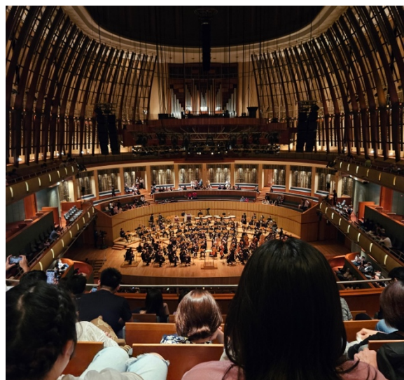
Från ett besök till "The Durian" som är en konserthall där vi såg klassisk musik för 11 dollar

På boendet jag hade erbjöds flertalet aktiviteter man kunde gå med i, de flesta var sportrelaterade. Jag gick dock aldrig med i någon, men känner flera som höll på med lite olika sporter och klubbar. Jag är osäker på om detta erbjöds på andra boendetyper. Det fanns även sportaktiviteter och sådan som erbjöds av skolan, som alla kunde gå med i. Jag spenderade det mesta av min fritid med att hänga med kompisarna där och utforska landet. Jag reste även en del och hann med att åka till Kuala Lumpur, Ho Chi Minh City, Filippinerna, Phuket och Chiang Mai under terminen. Efter terminen åkte jag till Sydkorea och Japan, och sen tillbaka till Singapore i några dagar.