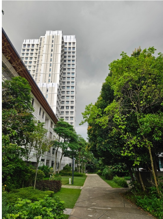
En bild från Campus, här gick jag nästan varje dag tillbaka till mitt boende.