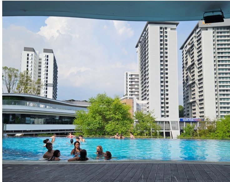
Infinity poolen på campus

Jag var väldigt nöjd med mitt boende och hade supertrevliga grannar! Det var också trevligt med måltidsplan, för man hittade nästan alltid någon man känner i matsalen och satt ofta länge och hängde med dem! Den enda nackdelen med måltidsplanen var att det kändes lite som att man var "tvungen" att gå dit, eftersom man redan betalat för den. Men det stoppade inte mig från att äta ute ändå.