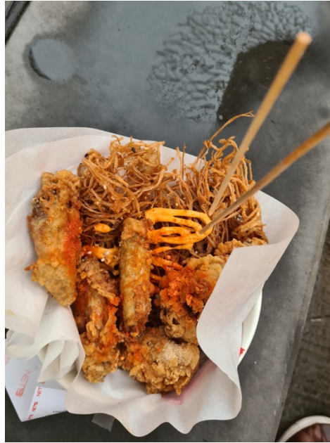
Bilder från Chinese New Year, som var tidigt under terminen. Bilden till höger är från ett street food event där de hade fantastisk friterad enoki-svamp.