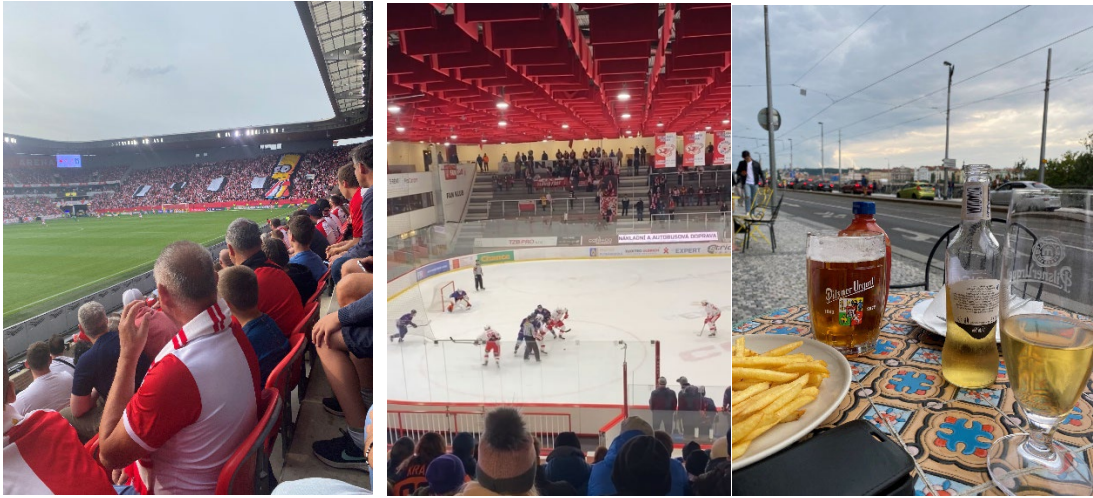
Slavia fotboll på sommarn och Slavia hockey på vintern

andra aktiviteter. Jag vet att man kan även skriva upp sig på diverse sporter om man vill det. Jag gillade mest att upptäcka staden, testa olika öl, kolla fotboll och hockey samt nattlivet.