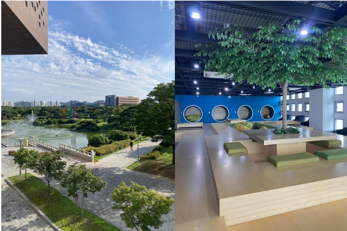
Campus – utsikten från biblioteket och där jag främst satt och pluggade

kursmålen, jag upplevde att de mest gav ut läxor för att vi skulle vara sysselsatta. Generellt så upplevde jag den mängden kurser och poäng som KTH förväntar sig att man ska läsa för att motsvara 30hp på KAIST som betydligt högre belastning än jämfört med den mängd tid man måste lägga ner i Sverige. Detta ledde till att jag hoppade av en kurs (läste motsvarigheten till 22,5hp) då jag pluggade över 50 h i veckan innan dess. Tror detta både berodde på kursen i sig men också sättet man förväntas plugga där med mycket läxor. Som jag uppfattade det så var det ännu tyngre att läsa på undergraduate nivå och det var inte ovanligt att se koreanska studenter sovandes i biblioteket. Jag brukade för det mest sitta och plugga i biblioteket och på de olika caféerna som finns lite här och var på campus.