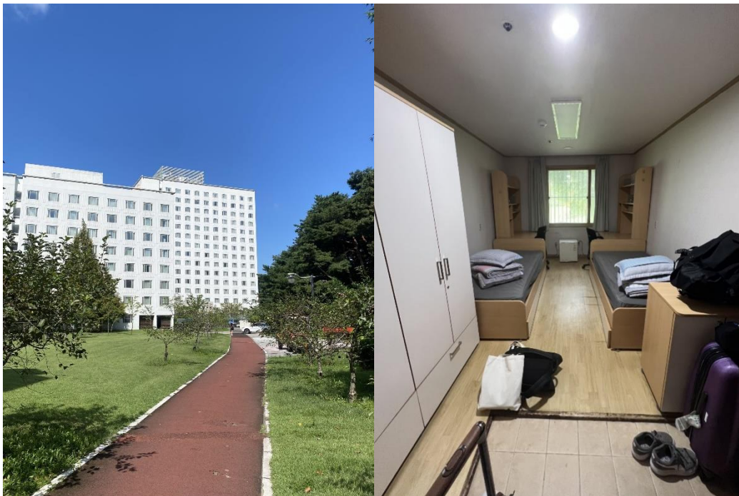
Dasom Hall och dormet

Jag bodde i W4-3 Dasom hall, de olika boenden var uppdelade i kön och om man var graduate eller undergraduate student men generellt så bodde alla internationella studenter på samma del av campus. Standarden på rummen var ungefär det man förväntar sig givet genomflödet av studenter och hur billigt boendet var. Jag delade rum med en annan tjej från KTH och även fast det finns singelrum så verkade det som att skolan föredrog att placera internationella studenter i dubbelrum oavsett. Vissa rum hade egen toalett och dusch men vi delade med resten av våningsplanet. Tvättstuga fanns också i huset. Det finns kök att hyra in sig i på en annan del av campus men jag kände inte att det var värt det. Varje dorm har en butik i lobbyn och det finns även mikro samt en maskin för att koka snabbnudlar.