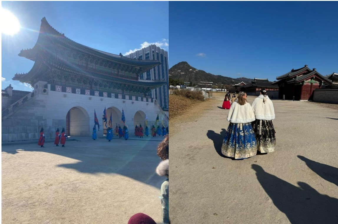
Hanboks och Palatsområdet i Seoul