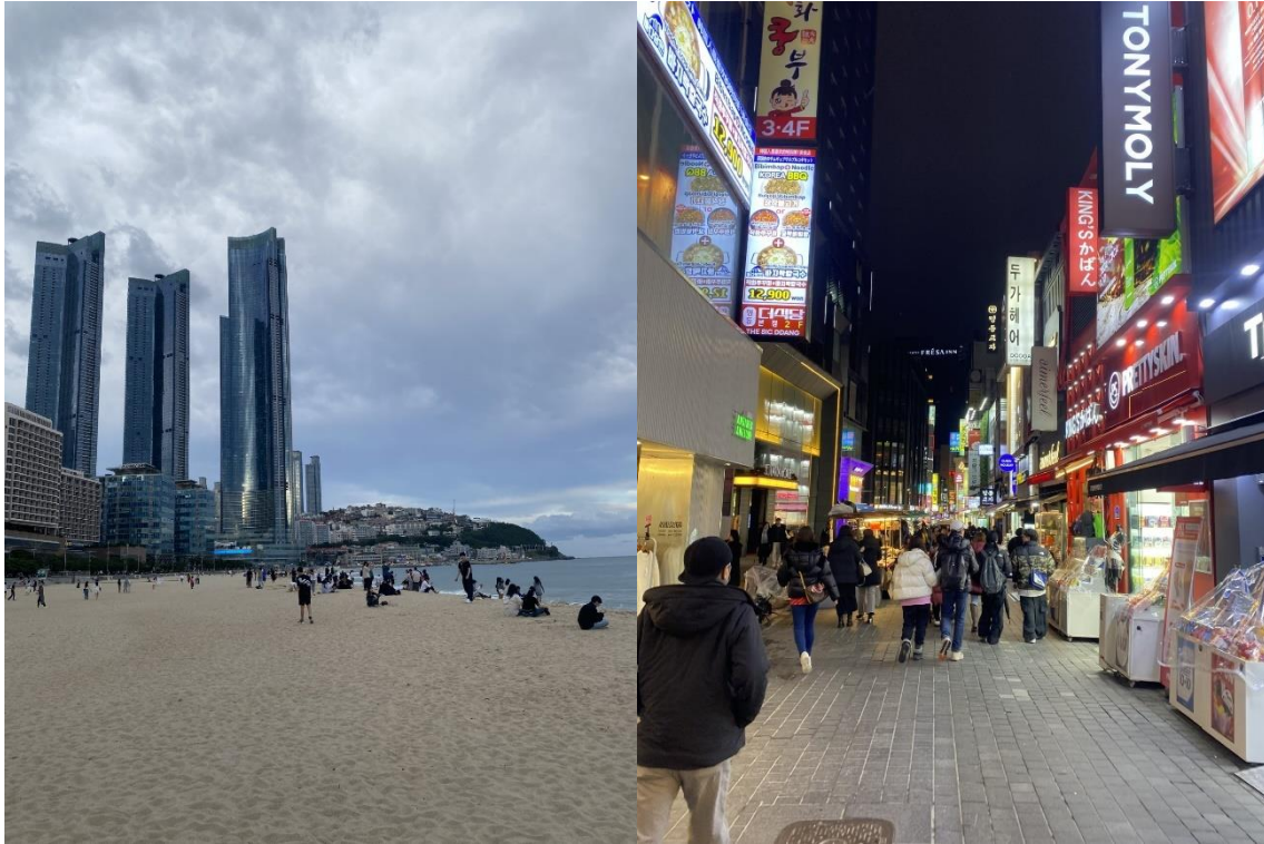
Busan och en matmarknad i Seoul

Slutligen så finns det mycket att utforska, Korea är ett fantastiskt land och jag kände verkligen att det fanns oändligt mycket att se inom själva landet. Resor till Seoul, Busan, Jeonju, Gyeongju och fler häftiga platser var ändå otroligt lättillgängliga och extremt värda att besöka. Jag hade lätt kunnat fortsätta utforska Korea i ett halvår till.