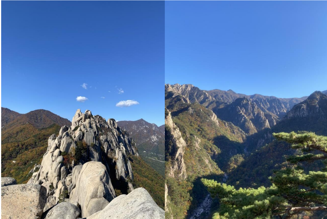
Seoraksan National Park

En av mina övriga favoritresor som vi gjorde var till ön Jeju, som brukar beskrivas som Koreas paradiso och motsvarighet till Gotland. En häftig vulkanisk ö känd för sina lavastenformationer, vattenfall, utbredda te- och mandarinodlingar samt Haenyeo, kvinnor som försörjer på att dyka efter skaldjur i farliga vatten.