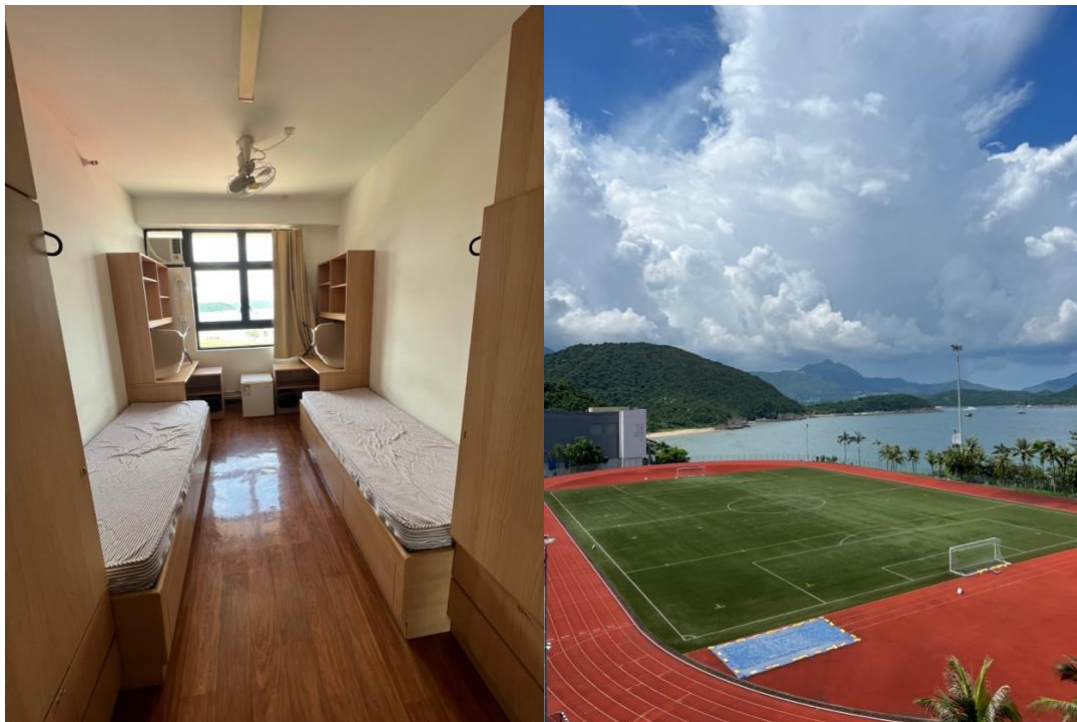
Boendet i Hall IX och utsikten från rummet.

Priset var totalt 15000 HKD om jag inte missminner mig, vilket blir strax över 5000kr i månaden som avgift för boendet, vilket jag absolut tycker är överkomligt.