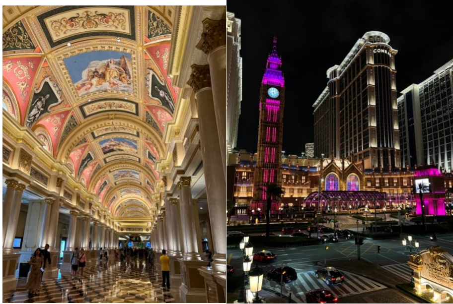
The venetian i Macau till vänster, samt utanför the Londoner.

Singapore och Malaysia (KL, och Lankawi) i en och samma veva