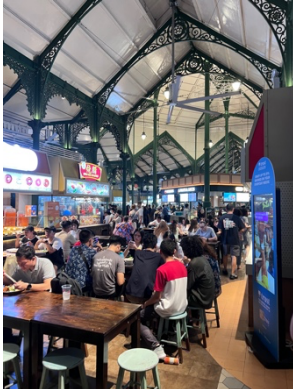
Lau Pa Sat

som annars ligger över svenska priser så åt de allra flesta allt som oftast på olika hawker centers. Här är några ställen värda ett besök.