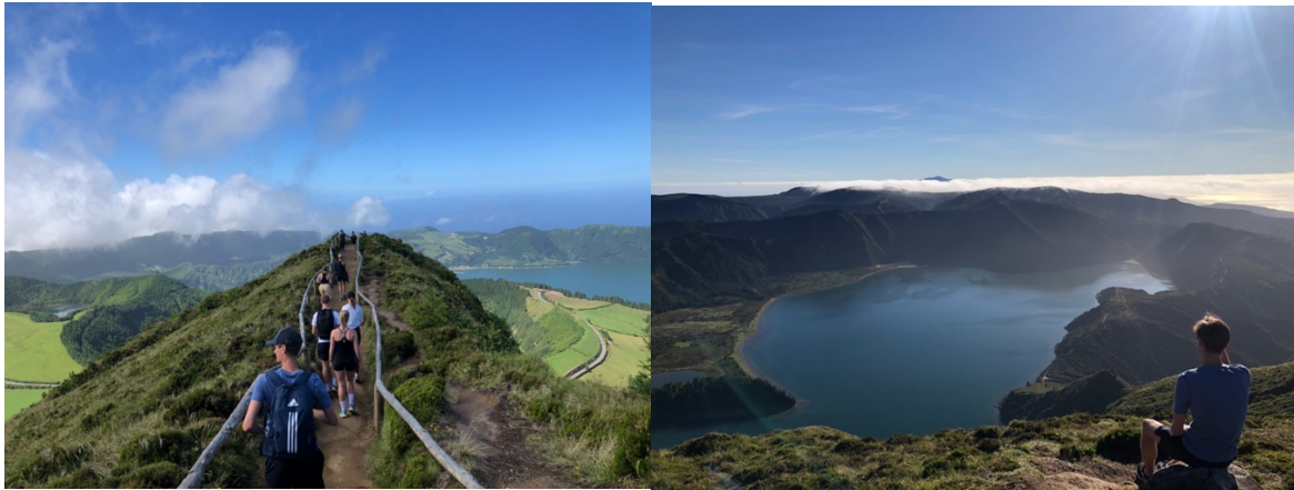
Sete cidades och Lagoa do Fogo på São Miguel, Azoreerna