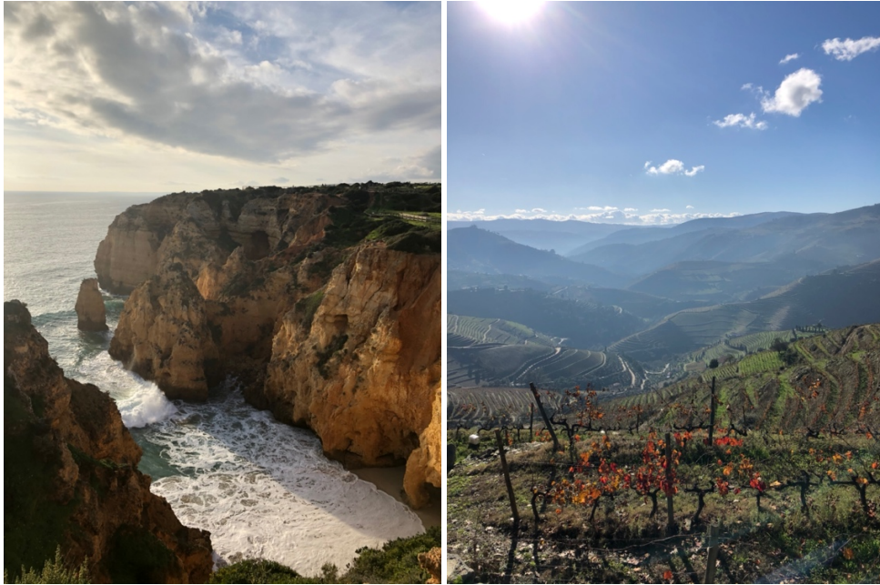
Algarves dramatiska kust och vinodlingar i Dourodalen