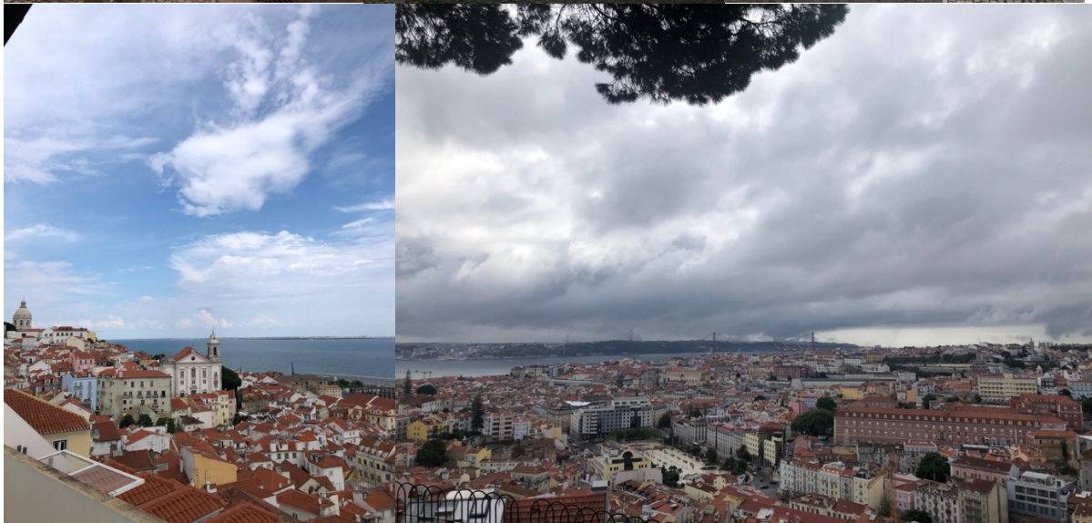
Lissabons fina gator och vyer