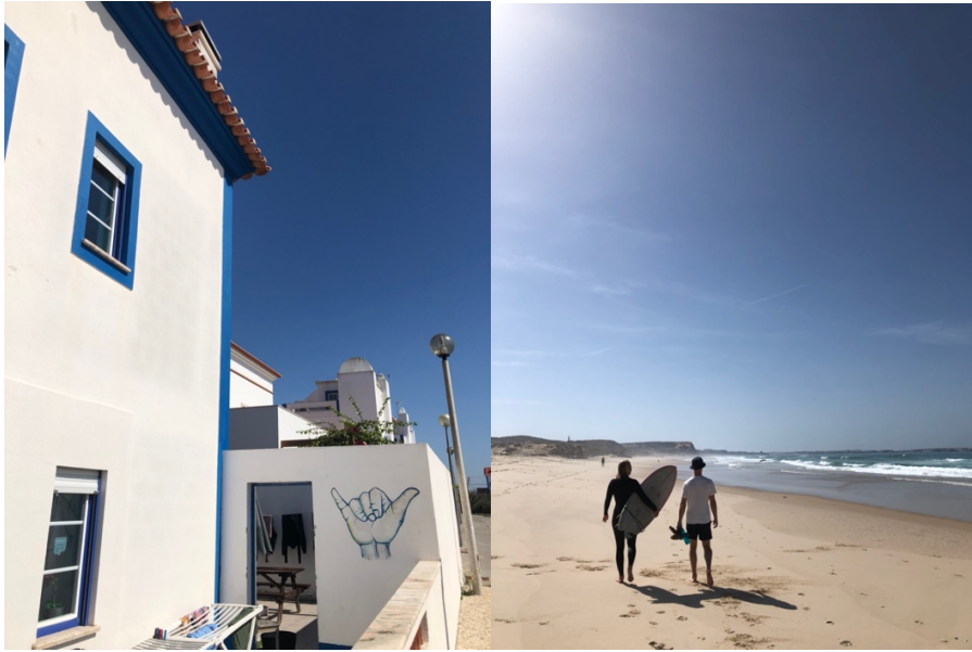
Surfhostel och Praia Almagreira i Baleal