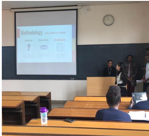
Presentation på skolan

För GDH-utbytet gick vi en kurs som gick ut på att utföra ett projekt tillsammans i en grupp, detta va väldigt spännande då jag då fick chansen att träffa och lära känna mina klasskamrater och också arbeta i grupp med de. Det va lite utmanande och lärorikt att jobba i gruppen då jag är van vid att arbeta på ett sätt som vi i Sverige gör, men i Kenya arbetar de på ett väldigt annorlunda sätt. Föreläsningarna och uppgifterna som vi fick va också annorlunda. I skolan i Kenya märker man att lärarna har väldigt mycket auktoritet och klyftan mellan lärare och studenter kan vara ganska stor.