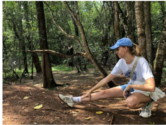
Apa på trädet i Karura Forest

Generellt sätt är kenyaner väldigt trevliga och välkomnande, så det var en del som kunde börja prata med mig utan någon anledning, vilket jag inte är van vid i och med att det inte brukar hända i Sverige. Förutom det som nämnt ovan så har Kenya en väldigt vacker natur med ett rikt djurliv. Förutom de fantastiska skogarna och djurfyllda naturreservaten så har de också (enligt mig) bland de bästa stränderna som finns. Jag har rest väldigt mycket och därför också sett väldigt mycket och Kenya ligger på topplistan vad gäller häftigaste naturen och finaste stränderna jag sett.