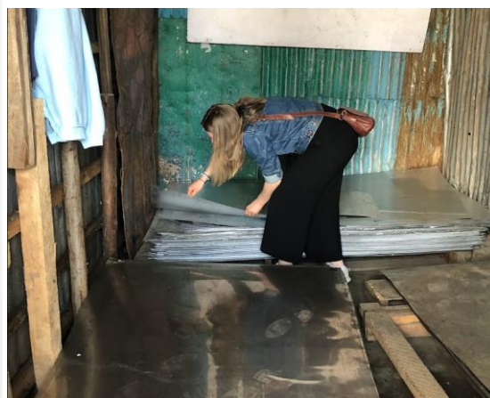
Undersöker befintliga material