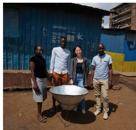
Första mötet med vår kontaktperson