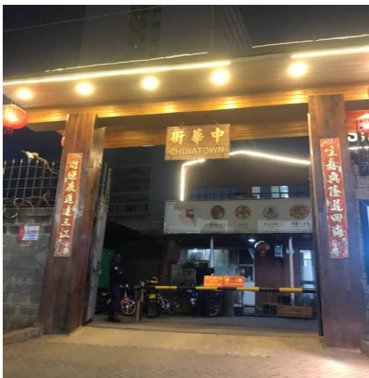
Ingången till Chinatown

Som nämnt förut så älskar jag att resa och lära mig om olika kulturer. Kenya är ett land med just en blandning av många olika kulturer, dels för att det finns mer än 50 ursprungliga stammar, dels för att många andra kulturer har under åren influerat landet. Det bor många indier i landet, ättlingar till dem som flyttade dit på tiden då båda länderna var brittiska kolonier, många kineser som har flyttat dit i och med att Kina på senaste tiden satsat mycket på att bygga ut infrastruktur i Afrika, sist men inte minst (framförallt vid kustområdena) mycket influenser från Storbritannien, Mellanöstern, Portugal och andra områden som under åren varit viktiga handelspartners till Kenya. Några sätt man kan se att de finns både många indier och kineser i Nairobi är att det till exempel finns skolor och kvarter som riktar sig till dessa såsom Chinatown i Nairobi med en massa restauranger och butiker som säljer kinesiska varor och mat. I och med att jag själv har kinesiskt påbrå och inte visste att Kina hade en så stor påverkan i Afrika så var jag lite osäker i början på hur jag skulle ställa mig till det.