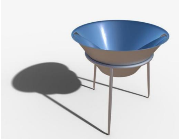
Koncept från föregående projekt

Vårt MFS-projekt var baserat på ett tidigare utfört masterarbete i samarbete med ingenjörer utan gränser som undersökte användningen av integrerade solugnar för att ta fram ett förbättrat koncept av solugnarna som finns i dagsläget. Tanken va att de skulle utföra en fältstudie i Kenya men tyvärr blev det inte av då det va under covid-pandemin. Vi fick därför förslaget av ingenjörer utan gränser att fortsätta deras arbete och utföra fältstudierna på plats. I och med att vi skulle skriva ett kandidatexamensarbete inom maskinkonstruktion fokuserade vi på att undersöka material och tillverkningsmetoder för den integrerade solugnen. Vi kollade bland annat på vilka möjligheter som fanns på plats, hållbarheten, kostnaden och vilka alternativ på material och tillverkningsmetoder som skulle passa bäst för vår kontaktperson som producerar solugnarna. Efter mycket undersökning och hjälp från vår kontaktperson Samuel kom vi till sist fram till en slutsats. I och med att vi skulle redovisa våra slutsatser för aktörer från både Sverige och Kenya, gjorde vi det online via zoom, vilket funkade bra det med.