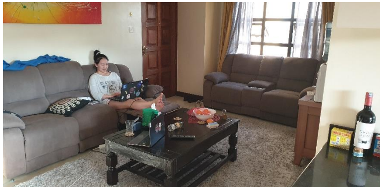
Vardagsrummet i boendet