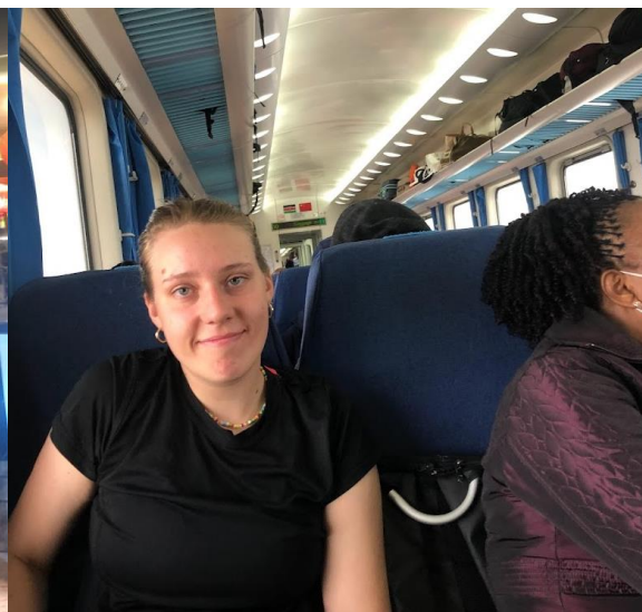
Tågvagn med kinesiska flaggan