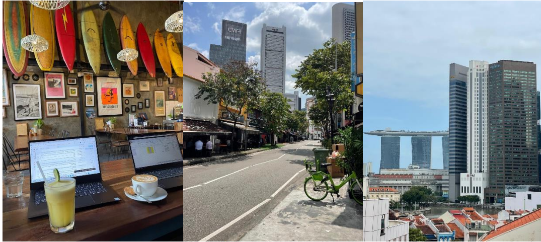
Från höger: 1. Distansarbete från Bali, 2. Lunchgata nära kontoret, 3. Utsikt från kontoret.