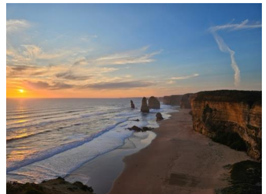
The Twelve Apostles, The Great Ocean Road

Melbourne är också känt för att ha fyra årstider på en och samma dag men jag var inte beredd på att det skulle vara så pass kallt när jag flög ner i början av juli. Det blev heller inte varmare förrän i slutet av oktober, så en varmare jacka är ett måste.