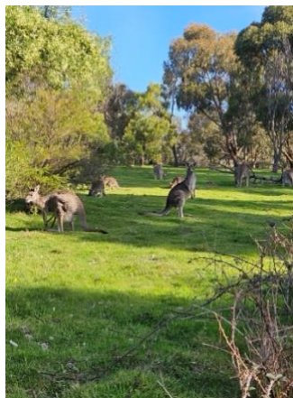
Kängurur i Westerfolds Park