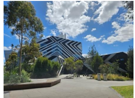
Ingenjörshögskolan i Clayton

Tillgodoräknades mot ME2321. Kursen riktade sig till maskinteknikstudenter och innehöll således många saker som var helt nya för mig. Trots detta var det inte alltför svårt att hänga med. Vi hade