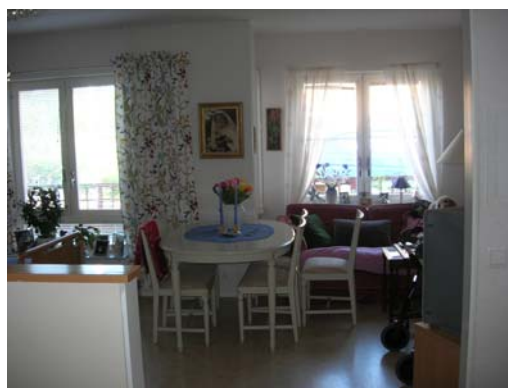
Bild 8. Hemkänsla i en lägenhet på Björkens äldreboende

Flera frågor i TESS-NH tar upp hemkänsla/hemlighet. När det gäller de gemensamma utrymmen finns där relevans men när det kommer till den privata delen är det återigen inte frågor för svenska förhållanden. Hemlighet skapas i lägenheten genom att den boende själv inreder sitt hem. Således är hemligheten inte visuellt bestämd utan ett resultat av självbestämmande. Någon fråga som omfattar arkitekturen finns inte, förutom förekomsten av olika gemensamma utrymmen på avdelningen, dessas storlek, antal sittplatser och om det finns en toalett i anslutning. Jag saknar frågor om gestaltningen, den yttre och den inre utformningen av miljön. Det finns en fråga om det finns en gård och/eller någon form av område för att vandra, som ligger i anslutning till avdelningen och som är tillgänglig för de boende. Den följande frågan handlar om hur attraktiv och funktionell gården är. Det kan vara en stor skillnad i poänggivningen, helt beroende vilken tid på året utvärderingen görs. Hur attraktiv är en gård i Sverige i november eller mars jämfört med sommarmånaderna?