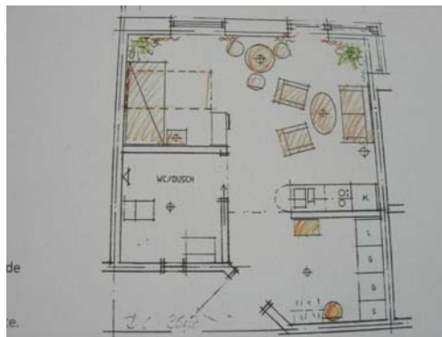
Bild 7. Planritning lägenhet

Enrumslägenheterna på Vigs Ängar har en yta som varierar mellan 35m 2 och 40m 2 . Lägenheten som besöks är en hörnlägenhet med stora fönster åt två håll och med uteplats. Lägenheten har en rymlig hall med goda förvaringsmöjligheter i garderober som ligger i ett eget utrymme bakom ett draperi. Mitt emot ligger den stora toaletten med dusch, som är utrustad med sedvanliga hjälpmedel som toalettstolsförhöjning med handtag och duschpall. Dörren är inte synlig från sängen, en medveten lösning enligt arkitekten. Man ska inte behöva ligga i sängen och störas av ljus, ljud och lukt från toaletterna. 20 Sängen är i stället vänd så att man har utsikt mot omgivningen. En enkel köksdel är integrerad i vardagsrumsdelen. Lägenheten är möblerad med den boendes egna ägodelar, vilket ger en god igenkänningsgrad och trygghet för de flesta. Sängen tillhör dock kommunen. Lägenheten har en egen uteplats som kan ses som en stödjande arkitektur för boende som tidigare har haft en trädgård. Uteplatsen möbleras också av de boende.