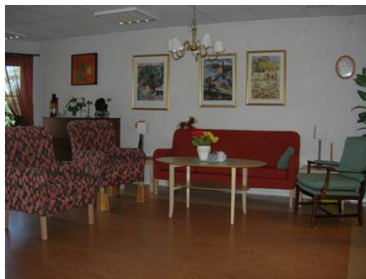
Bild 2. Vardagsrummet

Vardagsrummet smalnar av till en passage, med en soffa, in mot matrummet som ligger i öppen planlösning mot köket. Här finns ett stort matbord med plats för gemensamma måltider. Köksdelen ligger synlig men avgränsad av en bänk med underskåp som är öppet upp mot överskåpen. Detta skapar en möjlighet till kontakt mellan kök och matrum. Det ger också en större rumslig känsla trots att det inte finns någon vägg mellan dessa två funktioner. Matrumsdelen är ganska mörk men den ger ändå ett ombonat intryck. Ett fönster vetter ut mot husets baksida med träd och buskar.