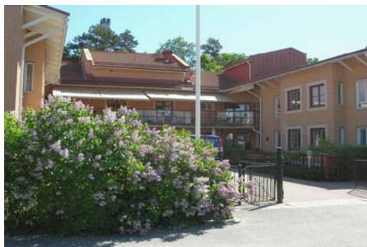
Bild 1. Björkens äldreboende

Björkens äldreboende ligger i Viksjö i Järfälla kommun nordväst om Stockholm. Viksjö har cirka femtontusen invånare. Det finns sju äldreboenden inom kommunen. Fyra av dessa drivs av privata entreprenörer och tre stycken drivs av kommunen. Kommunen äger alla fastigheterna. Detta är ett av de äldreboende som drivs av Järfälla kommun 14 . Björkens äldreboende är beläget i på en återvändsgata bland flerfamiljshus, bara ett par kvarter från Viksjö centrum. Äldreboendet har fyra avdelningar, varav en är reserverad för personer med demens. Varje avdelning har plats för tio boende i var sin lägenhet.