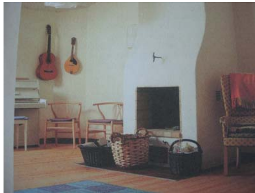
Bild 6. Allrummet

Denna avdelning är avsedd för personer med demenssjukdom. Dörrarna in till avdelningen, en i var ände av en korridor, är inte låsta. Om passage sker utan att en kod slås in, så går ett larm till personalens telefoner. Korridoren är svängd och det finns utblickar mot innergården. Överljus erhålls från högt belägna fönster i korridoren och lysrör. Väggarna är målade och golven har linoleummatta. Taken har träullplattor. Det är högt i taket i korridoren vilket ger en känsla av volym. Utmed gårdssidan är avdelningens tvättstuga belägen och här finns också ett kombinerat förråd och expedition för avdelningens personal. Mot gården vetter också de gemensamma utrymmena som avdelningens kök och allrum. Väggarna är målade i en ljus gul kulör. Allrummet är vackert möblerat med Wegners Y-stolar, möbler i ljust trä och gulmönstrade fåtöljer. En öppen spis används som samlingspunkt för samtal och högläsning. Vid mitt besök, strax före eftermiddagskaffe med hembakad morotskaka, stod en nyplockad bukett med hägg på bordet. I det stora öppna köket stod röda pelargoner på rad. I allrummet ligger ett trägolv.