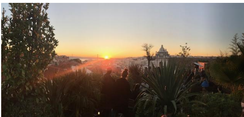
Utsikt från Park rooftop

längst med hela stranden där man kan ta kurser eller bara hyra en bräda och våtdräkt (för det är kallt i vattnet). I övrigt hittade jag väldigt bra vänner som jag hängde mycket med, gick ut och testade massa restauranger och drack drinkar på barer samt hängde på stränder såsom Estoril eller Cascais eller gjorde andra utflykter så fort vi fick chansen. Vi var iväg på två resor, en till staden Porto och en till