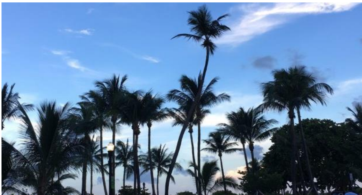
Jag besökte palmerna i Miami innan studierna började.

Bra att veta: med ett J-1 exchange visa får man anlända 30 dagar innan programstart, och även stanna kvar 30 dagar efter programavslutning (en så kallad "grace period"). Jag tog nytta av detta och tillbringade en vecka i Florida innan jag begav mig till Illinois.