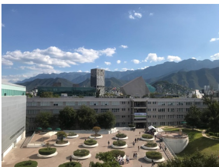
Figur 1 Utsikt över en del av campus

Universitetet och undervisningen skiljer sig mycket från KTH. En stor skillnad är att alla föreläsningar är obligatoriska, beroende på hur stor kurs du läser är du endast tillåten att missa tre till sex lektioner. En annan stor skillnad är att det delas ut läxor från lektion till lektion som sedan räknas in i ditt slutgiltiga betyg. Under terminens gång är det mellan två till tre delprov i varje kurs och sedan i slutet av terminen är det slutprov. Oftast är delproven lite mindre värda än slutprovet men det beror lite på hur läraren har valt att lägga upp kursen. Något som är skönt är att alla lektioner har ett fast schema så varje vecka ser likadan ut så man kommer snabbt in i rutiner. En annan sak som skiljer sig från KTH är tiderna då man kan ha lektioner. Lektioner sker mån-fredag mellan 07.00-21.00. Dock har du möjligheten att planera hur din vecka ska se ut beroende på vilka kurser du väljer samt vilken veckodag och tid, många kurser har flera olika klasser så man kan planera in så man får ett bra schema. Jag hade turen att jag kunde göra så jag endast hade lektioner mellan mån-tors så jag hade möjligheten att resa på helgerna.