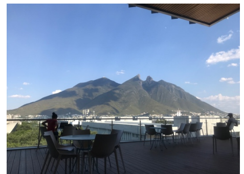
Figur 2 Takterassen i biblioteket med utsikt över sierra de lasilla

Universitet är det största i Mexiko, och har väldigt stort utbud av kurser. Om man endast vill läsa kurser på engelska är utbudet lite mindre i teknikkurserna än i kurser inom ekonomi och liknande. Universitet erbjuder spanskakurser samt även kurser i mexikans kultur som många utbytesstudenter läser.