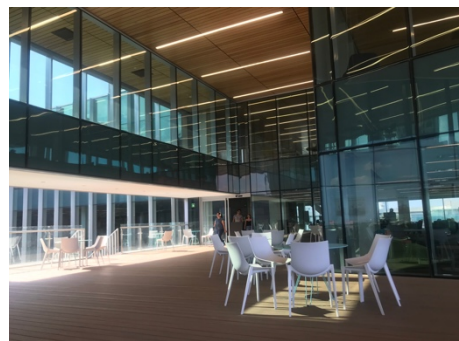
Figur 3 Takterassen i biblioteket