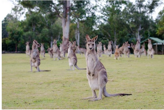
Bild 2 - Lone Pine Koala Sanctuary