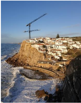
Azenhas do mar

De vackraste stränderna enligt mig var Riberia do cavalo, Praia da ursa och Galé beach i Troia. Tyvärr, är de lite svåråtkomliga men lätt värt det. Solnedgångarna är verkligen något speciellt med Portugal. Några tips är Belem, Carcavelos, Monsanto, Cacilhas eller Costa da Caparica.