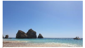
Praia da Riberia Do Cavalo

Något som man kunde klaga på var att tempot där var betydligt långsammare än i Sverige, speciellt gällande administrationen. Dessutom får man vara beredd på att Lissabon är väldigt backigt och på grund av gamla markplattor kunde det vara ganska halt ibland, klackskor rekommenderas inte. Man får även vara beredd på att portugiser inte dricker byggkaffe men om du finner detta svårt kan du gå till Copenhagen coffee lab, även ett ganska mysigt pluggställe.