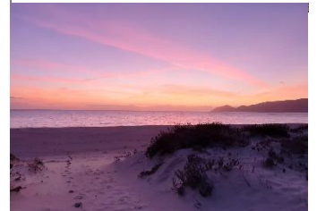
Galé beach, Troia