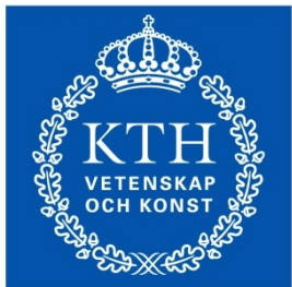
Bild- och videoteknik