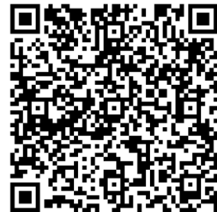
Pitch text document